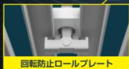
回転防止ロールプレート