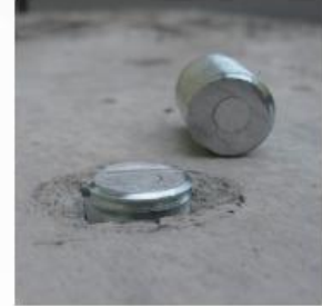
地上数ミリのツラ切断