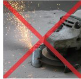
火花も少なくきれいで早く