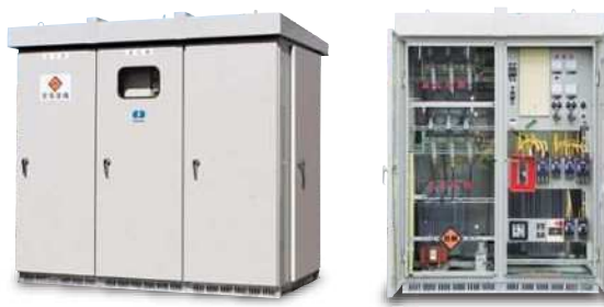
キュービクル式高圧受電設備