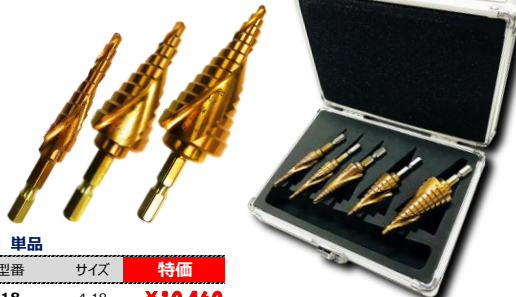
品名 コバルト竹ちゃん5本組フルセット 型番 TKC-5PC-F-SET 内容 TKC-12/13/18/22/28 各1本 特価 ¥47,000