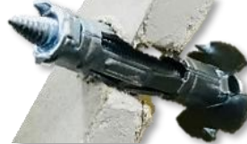
パラソルボードアンカー