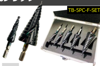
品名 竹ちゃんブラック5本組フルセット 型番 TB-5PC-F-SET 内容 TB-413/413/418/422/430 各1本 特価 ¥26,500