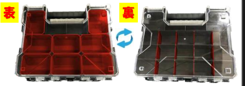
耐衝撃 クリアハードボックス ダブルタイプ 型番 サイズ (mm) 特価 CHB-300W W380×H310×D130 ¥8,400