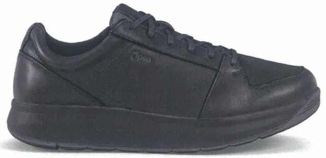
紳士 オリバー ブラックII